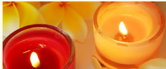
南国の香りとキャンドルに癒される1時間